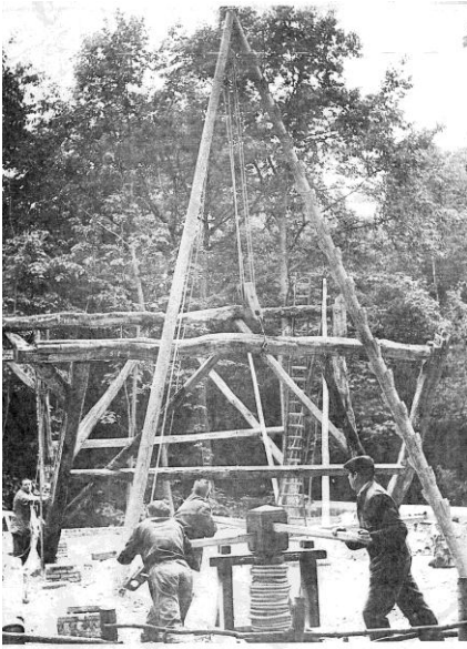
Foto 4: Optrekken van gebinte van een schuur uit Wortel in Bokrijk (jaren 50)