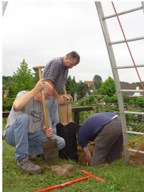
Plaatsen van een nieuw exemplaar.