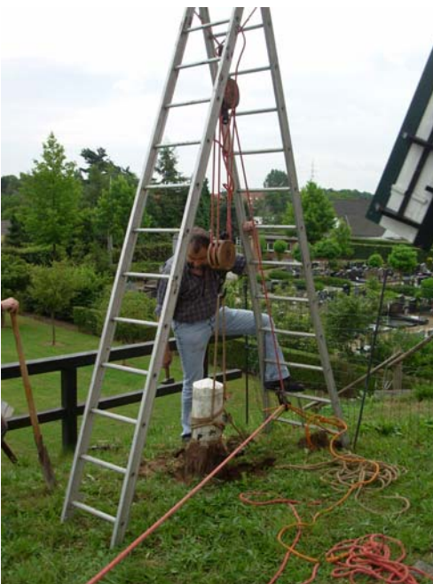
Verwijdering van een oude paal.