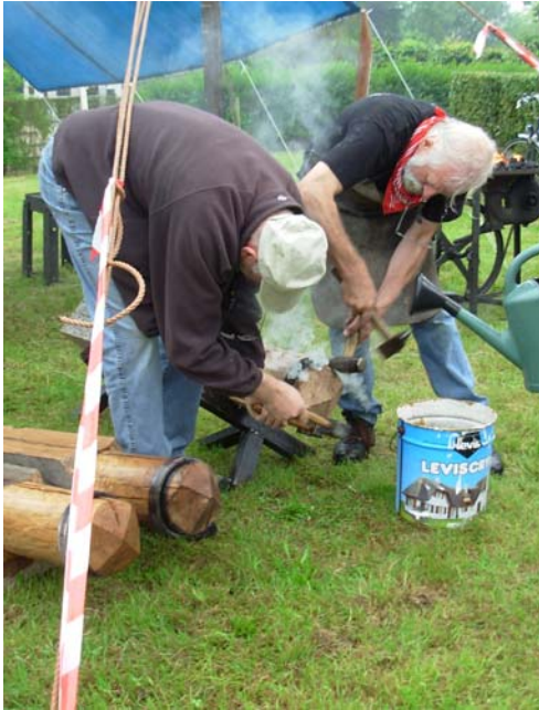
Het opslaan van een hete ring.

Tijdens een smeeddemonstratie op het Oelegems molenfeest in juni werden alle nieuwe kruipalen voorzien van een heet gestookte ijzeren ring. Die ring werd nadien krimpand afgekoeld met water. In juli verwijderden we de oude kruipalen. We schroeden het ondergrondse deel van de nieuwe palen met een roofingbrander om ze duurzamer te maken en tenslotte kregen ze hun voorziene plaats.