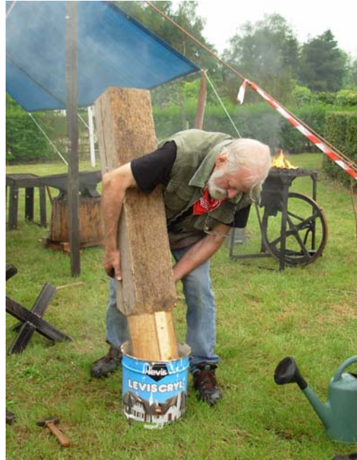
Het afkoelen van het ijzer.