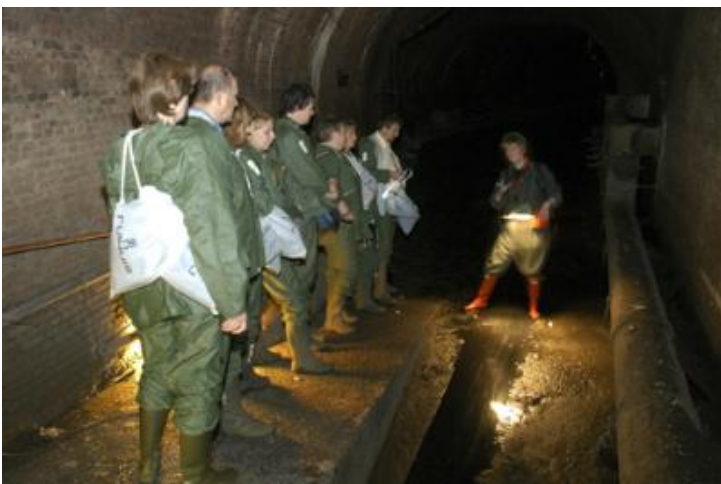
Een ondergronds avontuur in de buik van Antwerpen

Om veiligheidsredenen, bijvoorbeeld bij hevige regenval, kan het gebeuren dat de ondergrondse wandelingen niet kunnen doorgaan. In voorkomend geval vindt een bovengrondse wandeling plaats. Deze wandeling start in het Ruihuis waar u kennis maakt met de Ruien aan de hand van een filmpje en, indien de situatie het toelaat, u een stukje Rui per boot verkent. Bij deze vervallen de toegangstarieven.