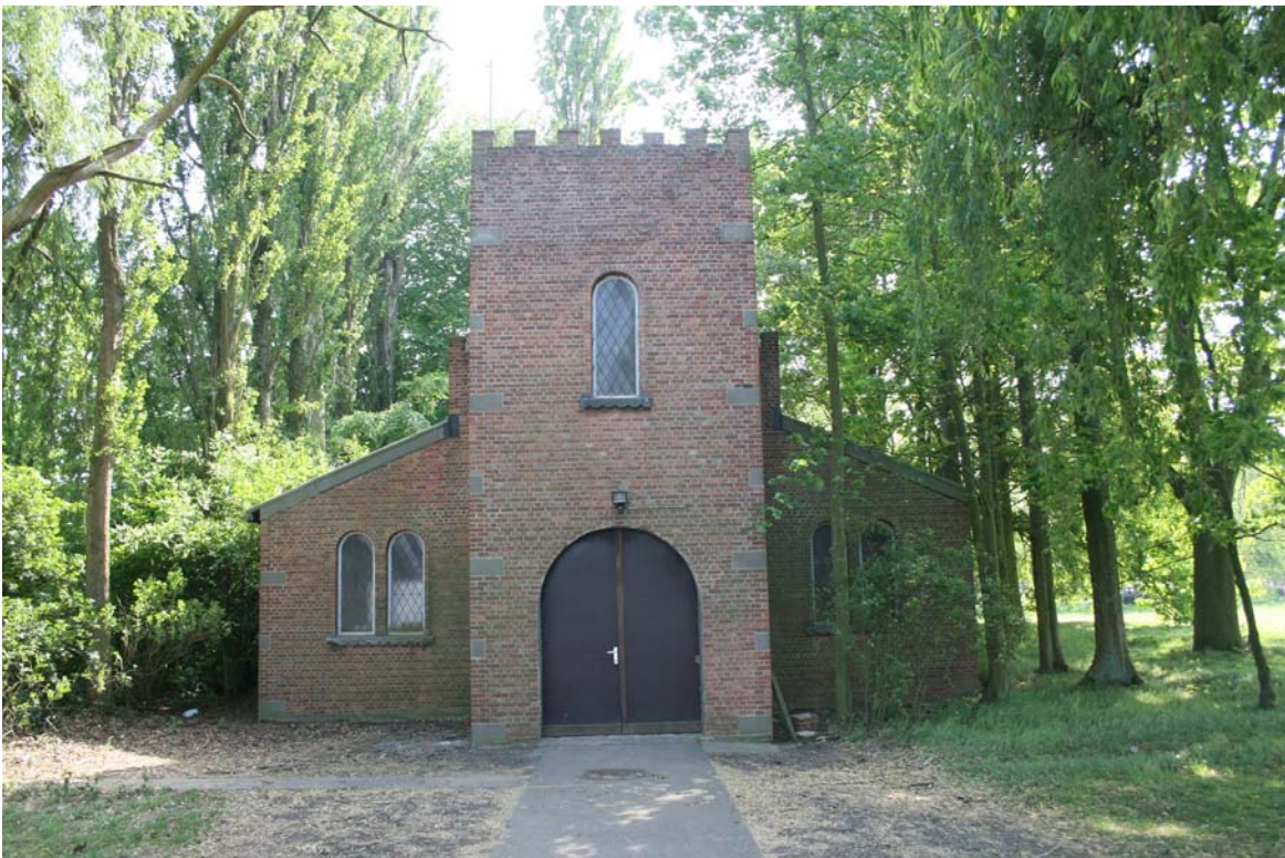
Foto: Kerkje op het Engels Kamp