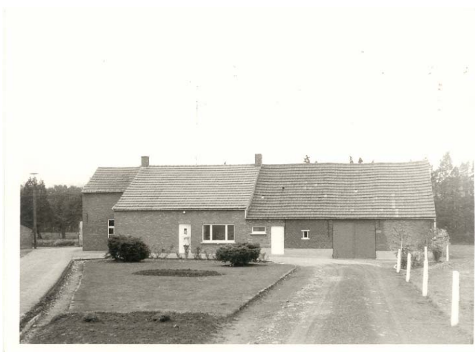
De Cruyhoeve of Massevere in november 1976